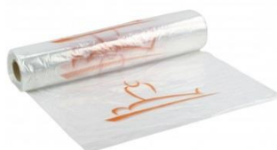
Artikel Nr: 125010 Schutzhülle