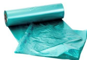
Artikel Nr: 125020 Gleitfolie